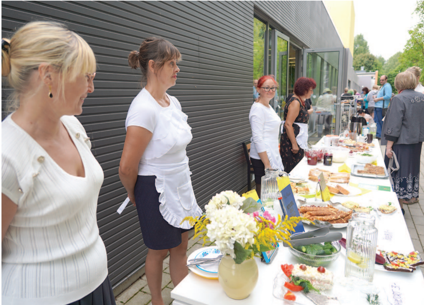
Raamatukogu kohvikus saab maitsvate suupistete kõrvale külastada raamatulaata ja kuulata luuletusi.