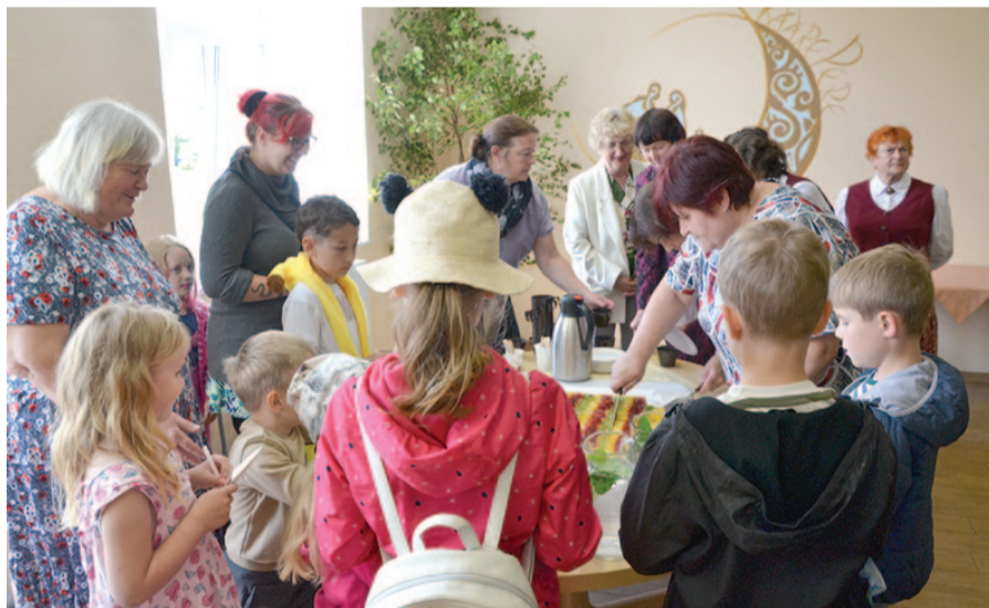
Küla ja kooli juubelile pühendatud kodukandipäeval pakuti pidupäevakoogi.