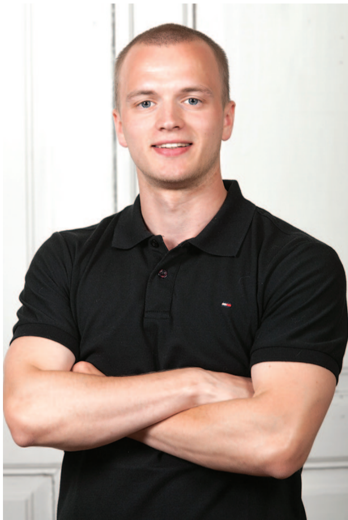
Dr Kiis käs varakevadel isapuhkuse kõrvalt kaks kuud Palamusel perearstiteenust tegemas. Selle ajaga sai talle selgeks, kui väga kohalikud inimesed soovivad ja vajavad, et Palamusel perearstiabi säiliks.

Valla loodav ettevõtte saabki pakkuda arstidele võimalust tegelda ravimisega, olemata sealjuures ise ettevõtja. Loodav ettevõtte peab tegutsemisvalmis