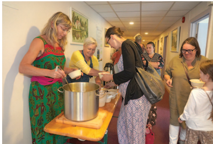
Sordikate kogukonnakonverentsi lõunapausil pakuti kohalikus Laut restos keedetud suppi.