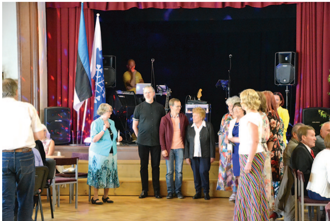
Kaarepere kooli vilistlasõhtul jäi kõlama soov viie aasta pärast uuesti kokku tulla.