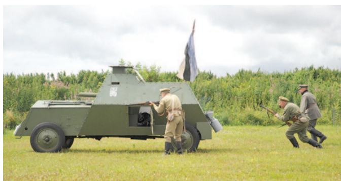
Ajaloo festivalil imiteeriti muu hulgas Vabadussõja aegset Aidu lahingut.