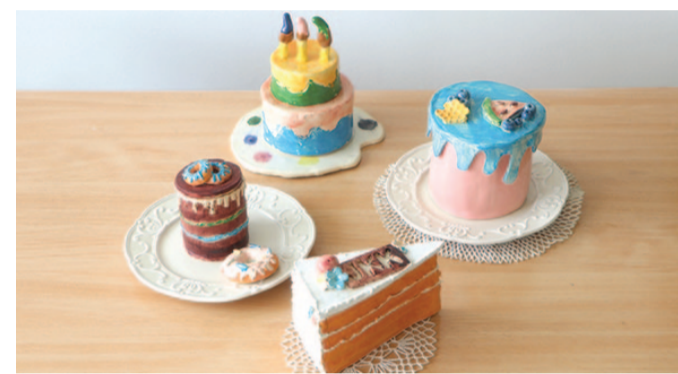
Keraamikanäitusel leiab kunstipäraseid magusaid hõrgutisi.