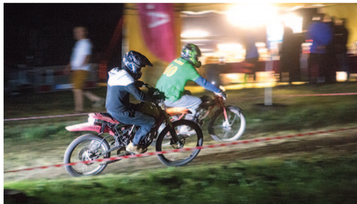
Punnvõrride kestvussõidul osalejatel tuli vahepeal kihutada ka pimedas.