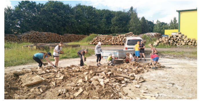
Malevlased firmas WestWood puuklotse ladumas.