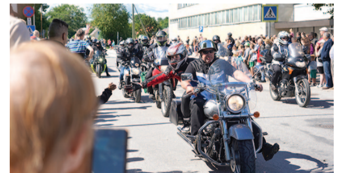
Trefilistele elasid kaasa tänava äärde kogunenud inimesed, kes soovisid tsiklimeestega patsu lüüa.

Motoparaadile pani punkti Kosmikute kontsert Jõgeva kultuurikeskuse suvelaval. JVT