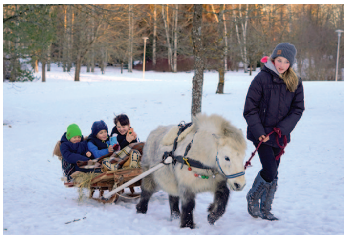
Piiri pargis said lapsed teha talvise hobusaanisõidu.