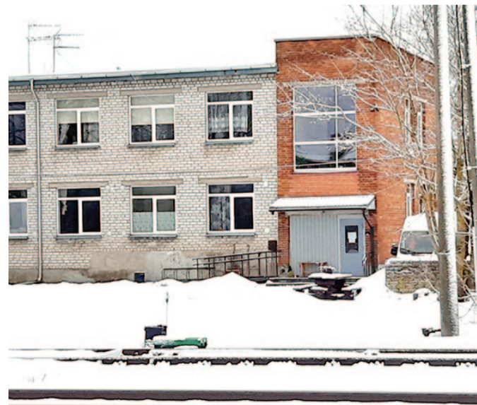
Sotsiaalimaja ehitustööd on plaanis ellu viia 2022. aasta lõpuks.