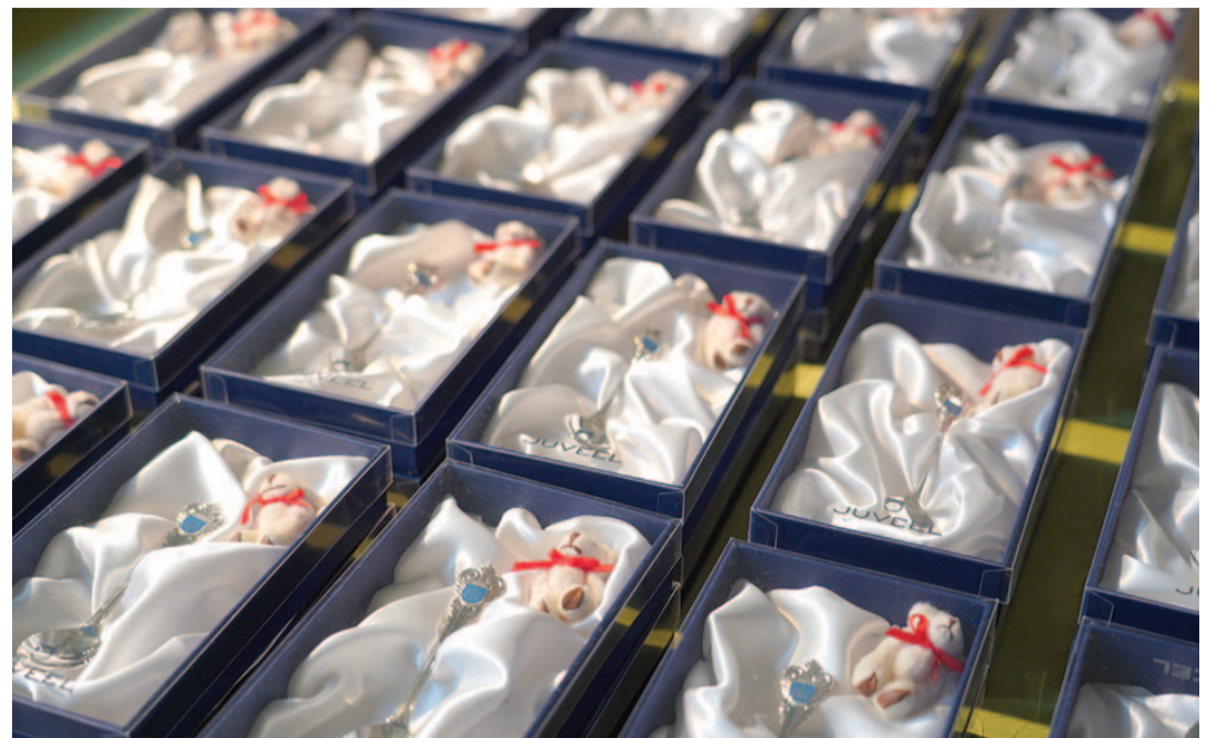
Valla noorimatele kodanikele kingib vallavalitsus hõbelusika.

Jõgeva valda saabus aasta jooksul elama 473 inimest, kuid samal ajavahemikul lahkus valla 488 inimest. Vallasisesest