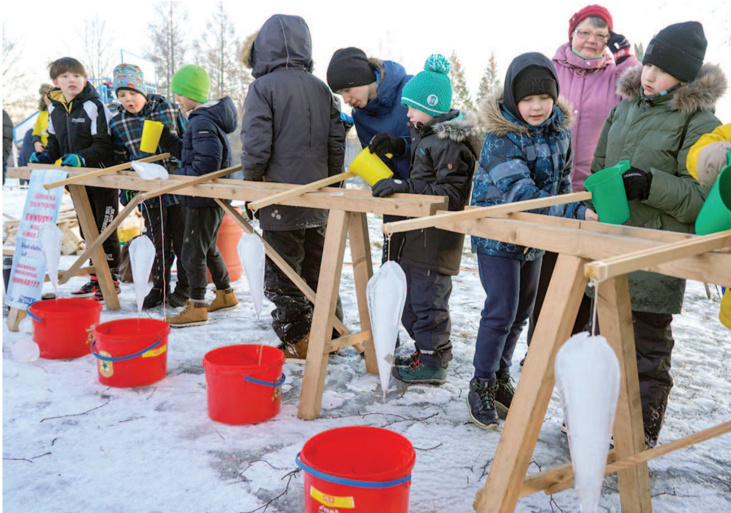
Sel aastal võeti mõõtu jääpurikate sulatamises.