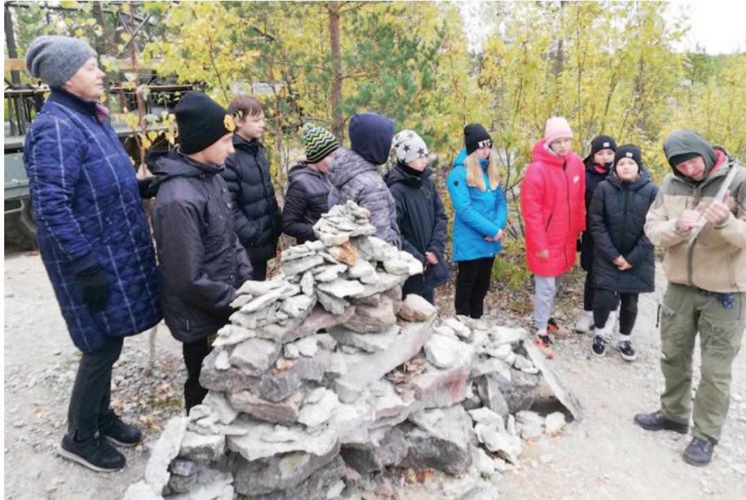
Karjäärifasifikal pakkus põnevat seiklust ning uusi teadmisi.

Veel kasutasime võimalust osaleda looduses toimetuleku matkal „Tarvilikud oskused looduses”, mida pakkus Kaitseliidu Jõgeva Maleva noorte kotkaste ja kodutütarde organisatsioon. Matkal osalesid 5. ja 7. klassi