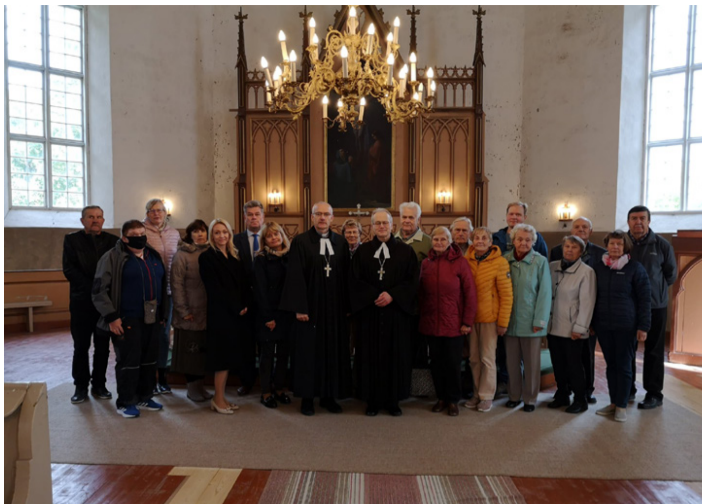
Kirikulised pärast Torma ja Püha koguduse ühist jumalateenistust.