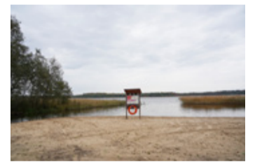
Vahepeal unustusse hõlma vajunud Järveotsa rand on taas korda saamas.

Nagu mujale randadesse, hakatakse ka Järveotsa randa igal