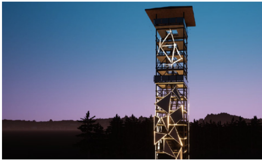
Pimedas saab torni täiesti teise kuju. Valgustus hoiab kohta ka pimedal ajal atraktiivsena. Eelprojekt: Inseneribüroo Urmas Nugin OÜ.

Vaatetorni üldkontseptsioon on kesken- dunud Struve geodeetilise punkti temaatikale ja teema kandub üle vaatetorni disainile. Planeeritav vaatetorn on u 30 meetri kõrgune metallist kandekonstruktsiooni ja 13 platvormiga. Teraskonstruktsioonist tornil on terastrossist piirded, et hoida vaateid maksimaalselt avatuna ning muuta torni olemus minimalistlikumaks ja kergemaks. Tornil välispinnalet on kinnitatud rooste-