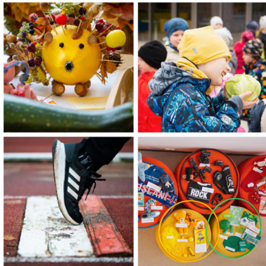
Jõgeva põhikoolis on sügise algus olnud sportlik ja värviline.