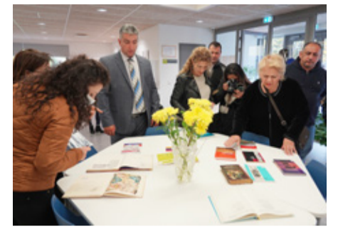
Alaverdi omavalitsuse delegatsioon leidis Jõgeva raamatukogu külastades oma röömuks ja üllatuseks väikese väljapaneku eestikeelset armeenia kirjandust. Näitus koostasid raamatukogu töötajad.

Alaverdi omavalitsuse esindus viibis Jõgeva vallas Eesti Idapartnerluse Keskuse koordineeritava projekti „Kasav ja läbi-