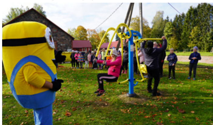
Sadala kooli juurde Baltic Agro toetusel rajatud väljõusaali võivad kasutada kõik huvilised.