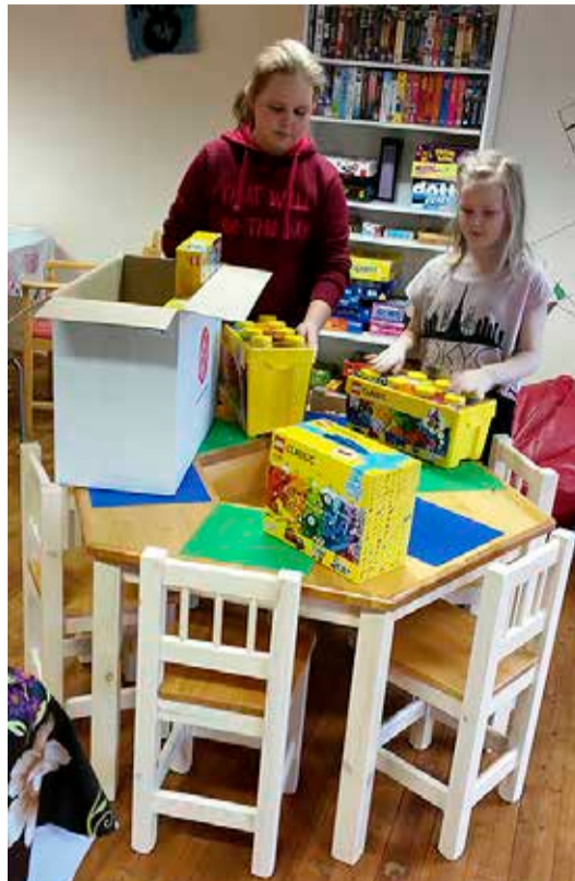
Sadala noortekeskusesse saabusid legolaud toolid ja legod.

Projekti saatis hindamisel edu, 200 laiki kogukonnalt tuli kiiresti. Tubli meeskond noorsootöötaja abiga korraldas vajalike vahendite soetamise. Tänu uuendustele on leidnud tee keskusesse hulk uusi noori. Tulemas on veel mitmeid huvitavaid üritusi selle projekti raames, kus saavad osaleda