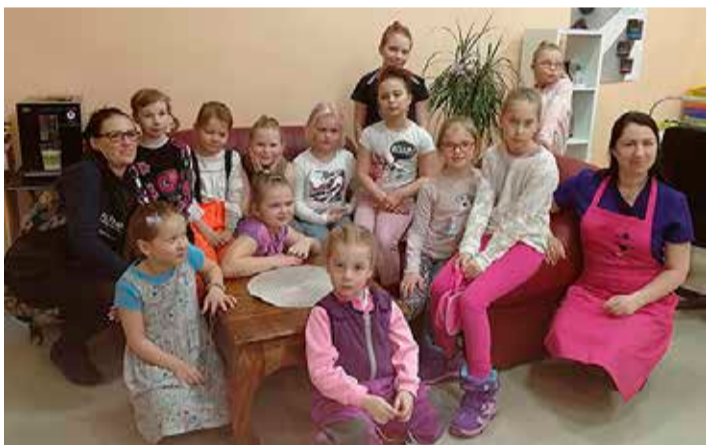
Kuremaa lasteaed-alkkooli tüdrukud külastasid Cateleya ilutuba.