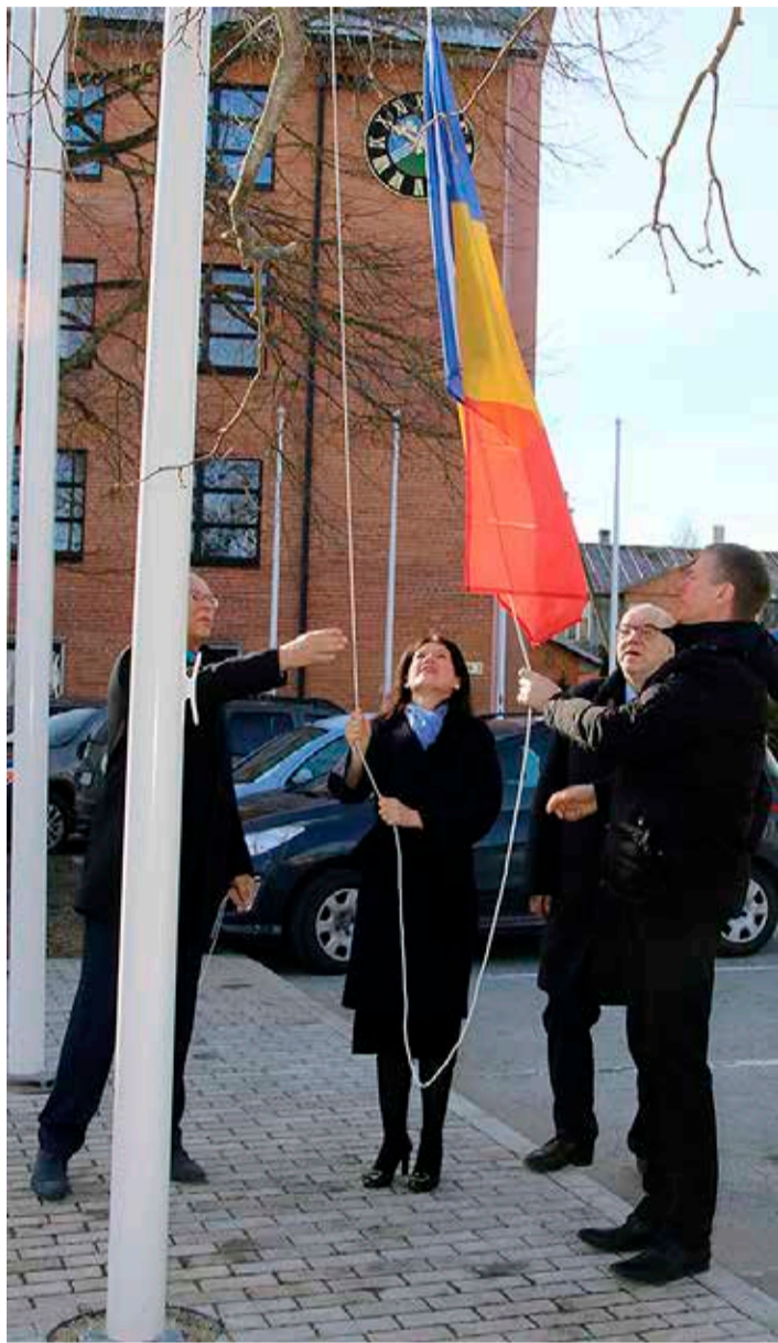
Suursaadik heiskas visiidi alguses Jõgeva vallavalitsuse ees Rumeenia lipu.

Turismi arendamise võimalused Eesti ja Rumeenia vahel pole kindlasti veel ammendatud, ent algust on tehtud: Eesti lennukompanii Nordica käivitas möödunud aastal hooajalised otselendused Rumeenia Musta mere äärsesse kuurortlinna