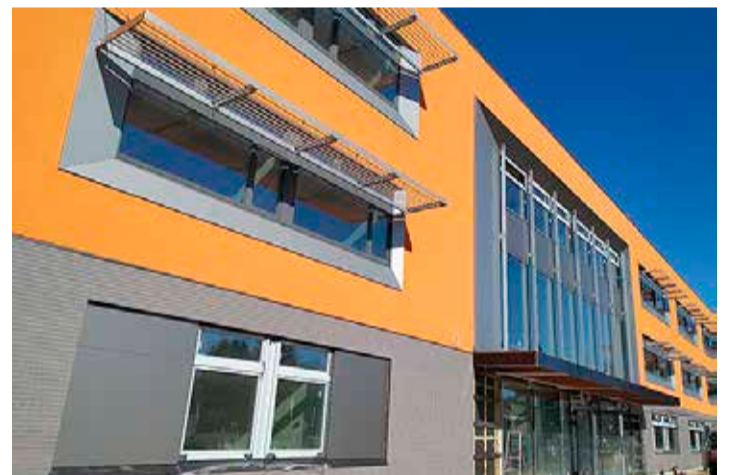
Koolimaja fassaad ja peasissepääs on pilgupüüdev.

Koolile soetatatakse ka uued köögiseadmed, mille osas on vallas hankedeping sõlmitud OÜ-ga Kõogiabi. Sisustuse hankele on pakumused laekunud, ette-