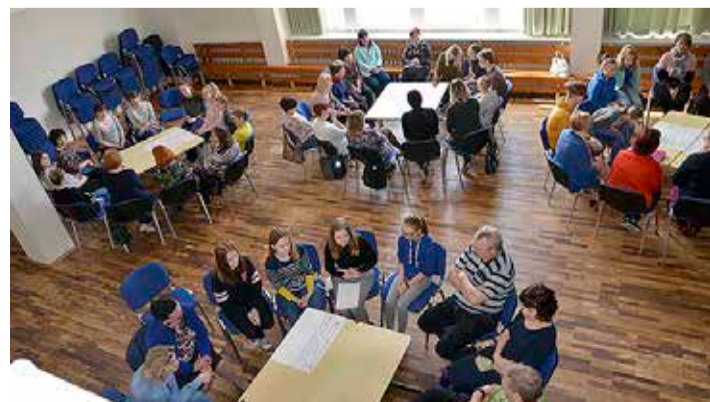
Õpilasesinduse ja õpetajate kohtumine.