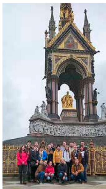
Torma kooli reisiseltskond Londonis prints Alberti memoriaali ees.

Tagasisõit oli üsna väsitav, ent õpilased said endaga hästi