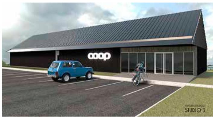
Sadala poe eskiis. FOTO: ARHITEKTUURIBÜROO STUDIO-3

Rekonstrueeritava kaupluse arhitektuurne lahendus on kavandatud lihtne ja selge ning olemasolevat keskkonda arvestav. Asendiplaaniliselt ja mahuliselt jääb uue kauplusehoone maht suhtlema teisel pool teed asuva Sadala põhikooli hoonega. Hoone saab plekiga kaetud viilkatuse, fassaadi viimistluses on kasutatud puitribisid. Laiad katuseraastad võimaldavad seinääres varikat all hoida jalgrattaid. Hoonesse on kavandatud umbes 200 ruutmeetri suurune müügisaal ühe kassakohaga, kauba vastuvõturuum, taara vastuvõtu ruum ning mittekõetav taarahoidla, personalile on ette nähtud riietusruum, tualett