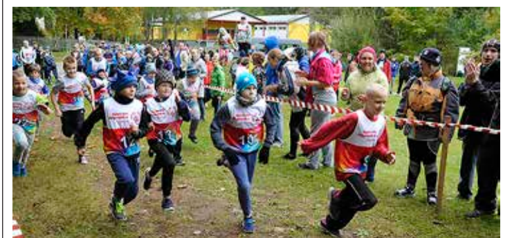
Siimustis osales Eesti Eriolümpia jooksukrossil üle kaheksaja jooksuhuvilise.