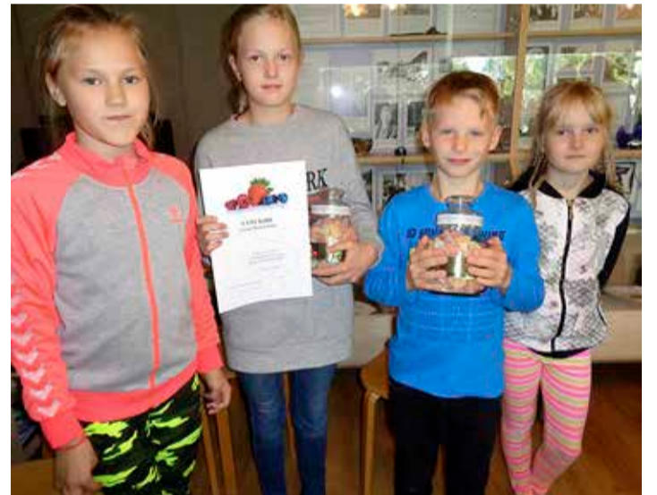
Siimusti Suvemari parimad lugejad.