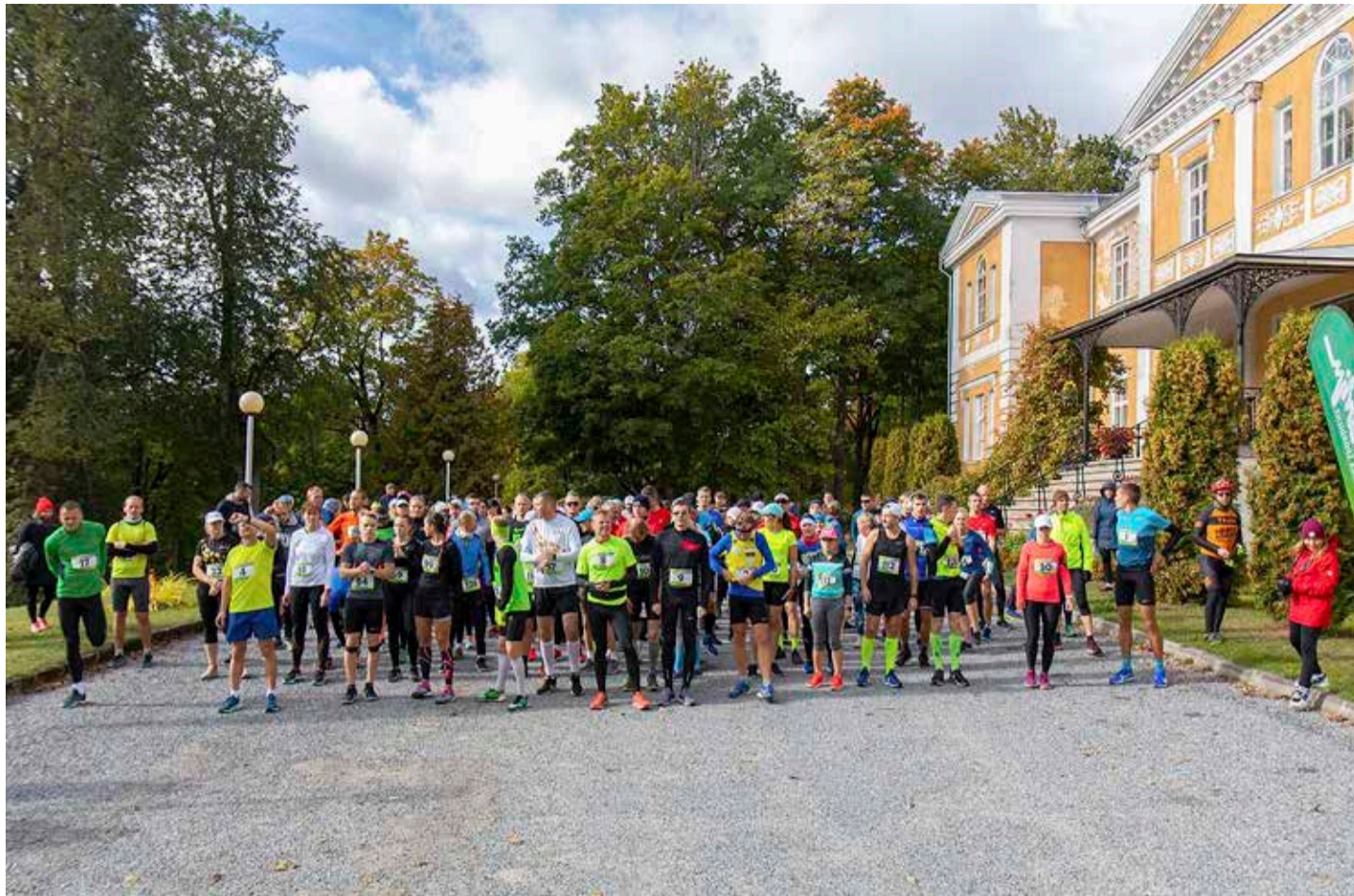
Poolmaratoni start anti Kuremaa lossi eest ning rada viis läbi Kuremaa järve rannaala, terviseradade, Vilina küla ja Laiuse aleviku ning üle Laiuse mäe.