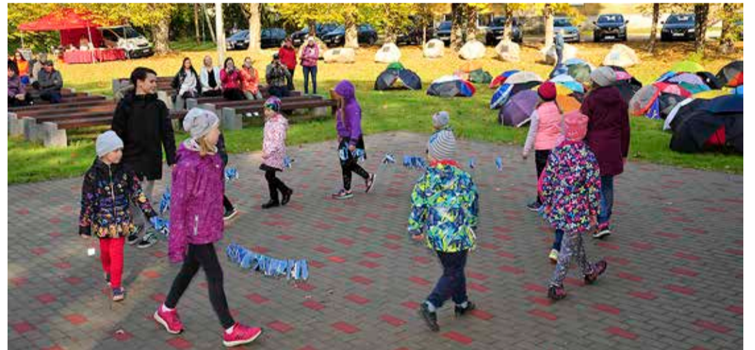
Sadalas tähistati Maal elamise päeva vihmavarjude näituse ning kogukonnapeoga.