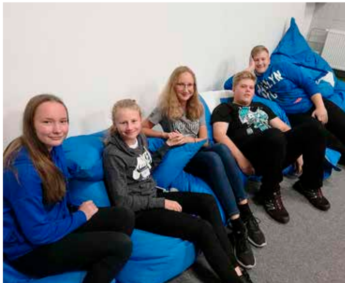
Jõgeva valla noored töötasid ideepahvakul välja projektiidee.