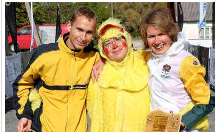
Viie silla jooksu võitjad Tibuga.