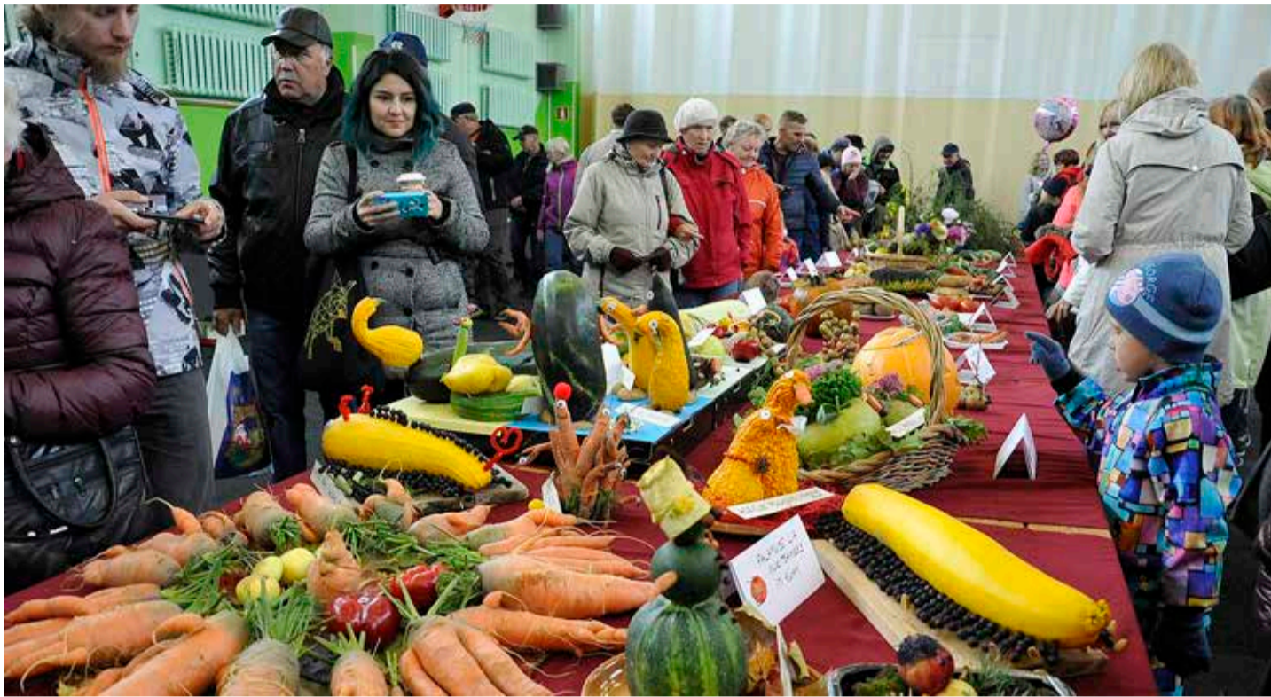
Traditsiooniliselt nunnunäitusel käivad läbi peaaegu kõik väljanäituse külastajad.