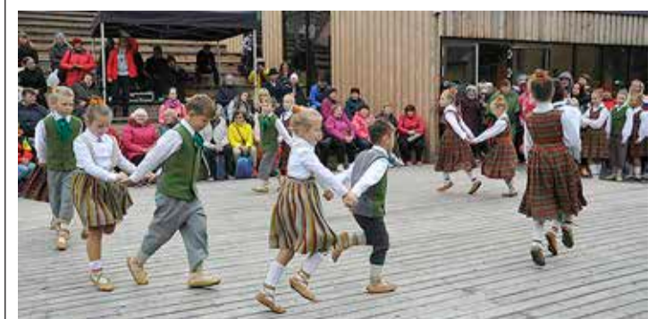
Paunvere väljanäitusel esindasid Jõgeva valla sõpruspiirkondi ametlikud delegatsioonid, aga ka läti tantsijatest kultuurisaadikud. Pildil Priekuli laste tantsurühm.