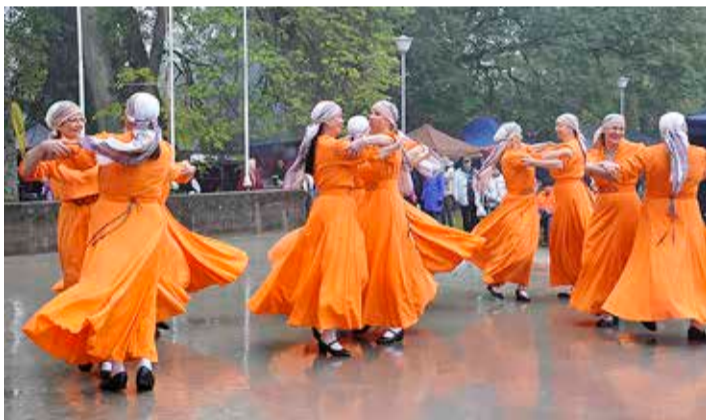
Väljanäituse kultuuriprogrammi tõi erksaid värve Palamuse naisrühm Sirtsuline.

Palamusel peeti 21. septembril XXII suurt Paunvere väljanäitust ja laata. Ilmatargad, kes selleks päevaks vihma ennustasid, „lõikasid“ seekord „näppu“: taeva-luugid püsisid väljanäituse ajal kenasti kinni.